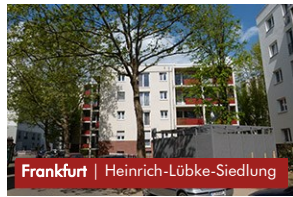
Frankfurt | Heinrich-Lübke-Siedlung