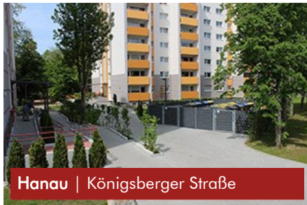
Hanau | Königsberger Straße

Architekten, Ingenieure und Fachplaner bilden ein gemeinsames Projektteam und arbeiten Hand in Hand.