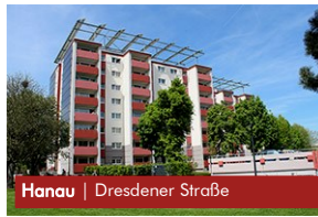
Hanau | Dresdener Straße