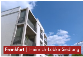
Frankfurt | Heinrich-Lübke-Siedlung