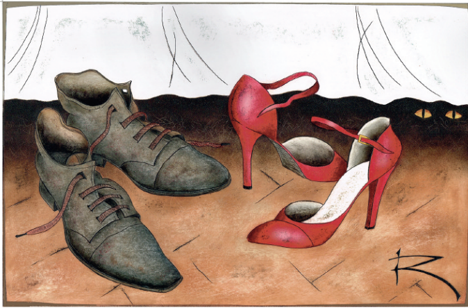
Der Spion, Grattage, 2018